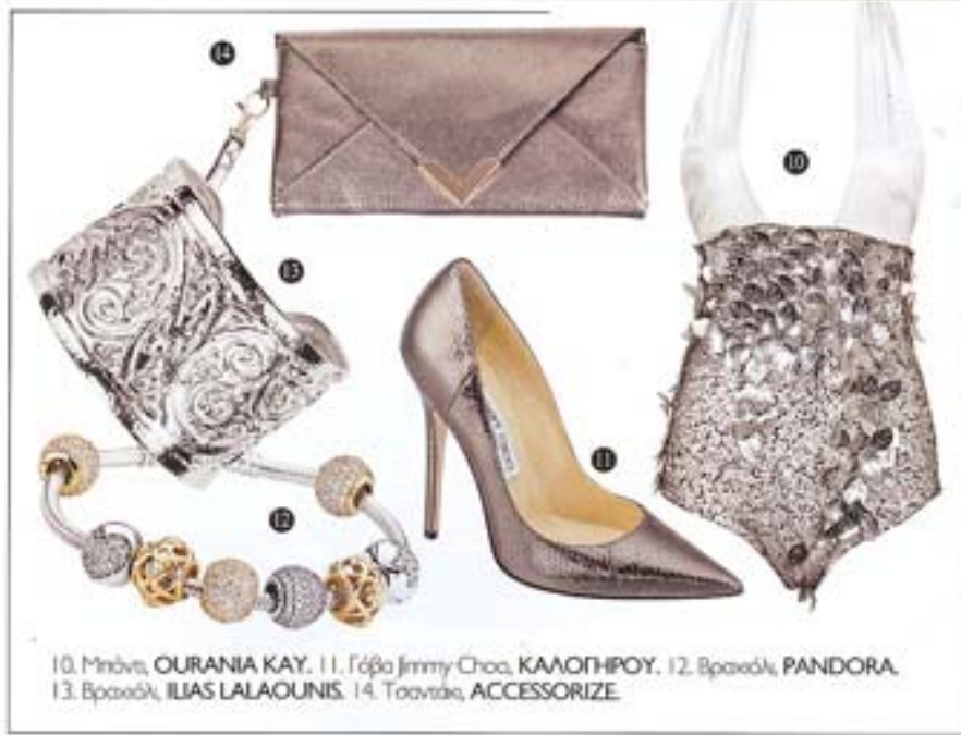
10. Μιμούστα, OURANIA KAY. 11. Γόβα Jimmy Choo, ΚΑΛΟΓΗΡΟΥ. 12. Βρασιόλι, PANDORA. 13. Βρασιόλι, ILIAS LALAOUNIS. 14. Τσάντα, ACCESSORIZE