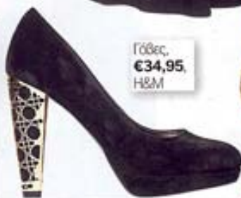
Γόβες, €34,95, H&M