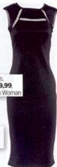
Μίντι, €29,99, Pink Woman