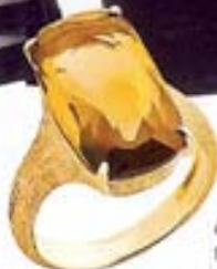
Δαχτυλίδι με ημιμόλιθμη πέτρα, Murano Collection, Marco Blocco