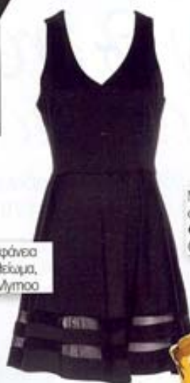
Με όνομα στην νήσσο, €39,90, Celestina