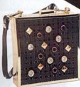
Τσαντάκι, €47,30, Daca